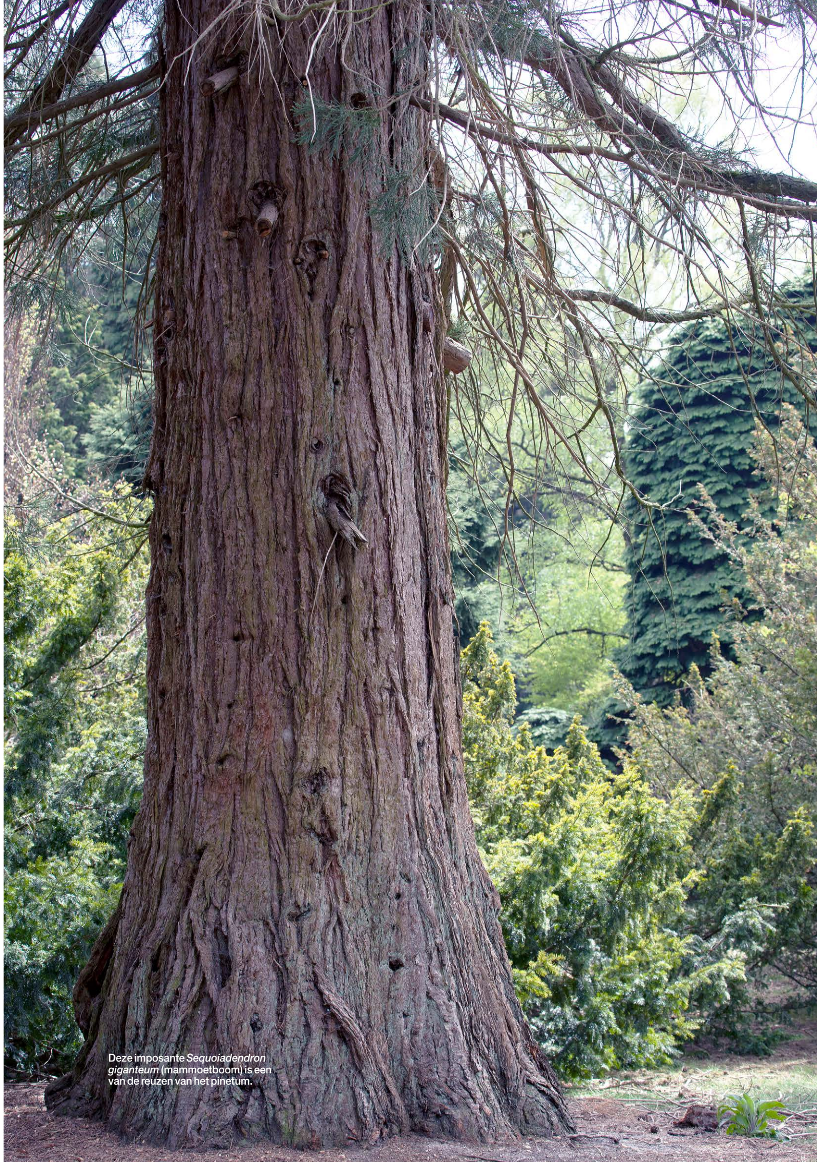
Deze imposante Sequoiadendron giganteum (mammoetboom) is een van de reuzen van het pinetum.