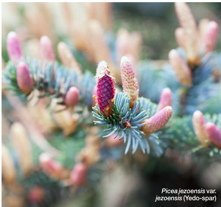
Picea jezoensis var. jezoensis (Yedo-spar)

‘Ik vind het belangrijk dat coniferen de ruimte krijgen die ze verdienen.’